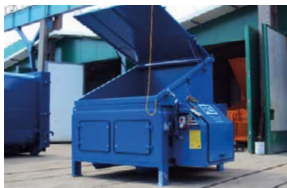
Inkast från mark med låsbart lock.

minskar antalet transporter avsevärt. Kompressorerna är förberedda för att kunna kombineras med alla vanliga lyftanordningar.