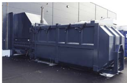
Inkasttratt med vägganslutning.