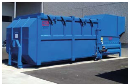
Inkasttratt med vägganslutning.